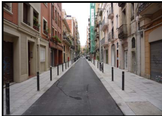
Carrer on es troba el nostre centre.

Finalment el mes de setembre de 1998 es lloga el local del número 30 del mateix carrer, cosa que permet unir els tres locals (nº 28, nº 30 i nº 32), ampliant-se novament la sala del menjador i creant una cuina nova i més moderna per poder atendre la demanda d'aquest servei.