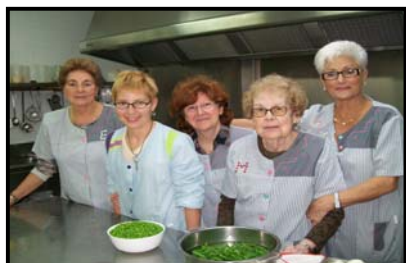
Grup del Dijous