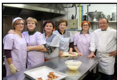
Grup del Dilluns

Cada dia es fan 70 àpats. El personal voluntari de la cuina es distribueix per torns diaris (unes 5 o 6 cuineres cada dia). Aquest servei s'ofereix a aquelles persones que no tenen recursos econòmics o presenten notables dificultats físiques per poder cuinar. S'organitzen dinars en el nostre centre en dies assenyalats (com el dia de Nadal) on acudeixen els usuaris del servei de menjador per a que en dies tan especials com aquests no es trobin tan sols.