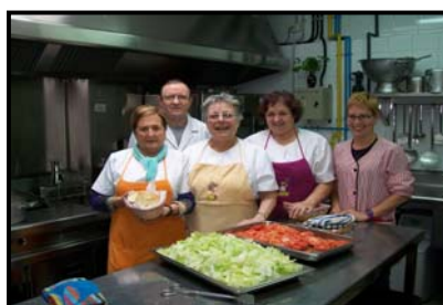
Grup del Dimarts