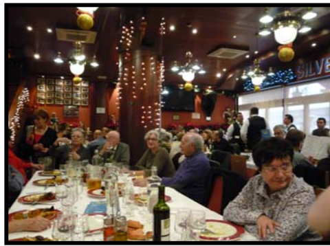
“Dinar de Germanor”

El dia 25 de desembre es celebra el dinar de Nadal al menjador de l'Obra Social amb tots els avis i avies que es troben vivint sols i que volen venir a celebrar aquest dia tant especial amb nosaltres.