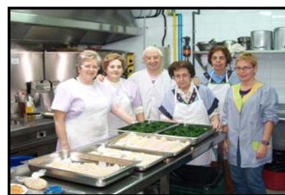
Grup del Dimecres