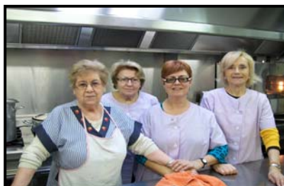
Grup del Divendres